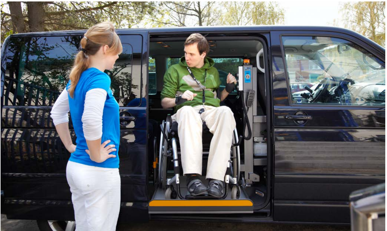
Abb. 7 Fahrzeugeigene Hebebühne für Rollstuhlfahrer

Die Übertragung von Aufgaben sollte schriftlich erfolgen. Dabei muss klar und deutlich hervorgehen, welche Aufgaben in welchem Arbeitsbereich wie erledigt werden sollen. Jede/jeder Beschäftigte, muss konkret wissen, was zu tun ist. So kann beispielsweise dort stehen, dass auf Station X Menschen grundsätzlich mit Hilfe eines Lifters oder eines Rutschbrettes transferiert werden. Dies ist auch in der Pflegeplanung beispielsweise in Form eines Bewegungsplans zu dokumentieren. Auch Ausnahmen hiervon müssen begründet in die Pflegeplanung des einzelnen Menschen aufgenommen werden.