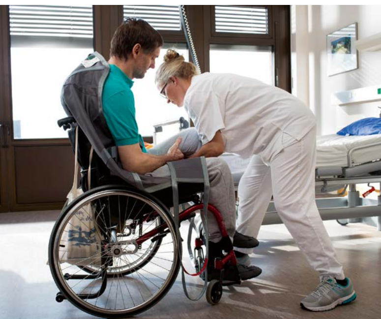
Abb. 3 Anlegen eines Lifertuchs im Rollstuhl für das Deckenschienensystem

Erforderlich ist die Bereitstellung von Hilfsmitteln für alle Situationen, in denen die Gefährdungen durch diese vermieden/minimiert werden können und der Hilfsmiteinsatz praktikabel ist. Vor allem sind dies Technische und Kleine Hilfsmittel zur Bewegungsunterstützung und Hilfsmittel zur Positionsunterstützung: