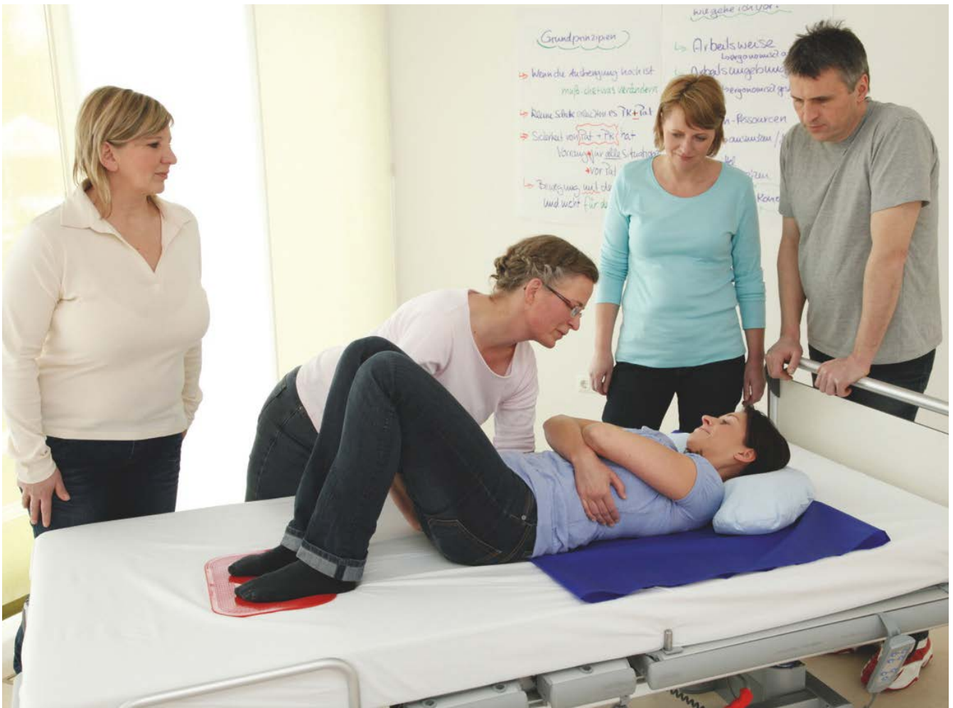
Abb. 8 Unterweisung in der ergonomischen Arbeitsweise: Bewegen einer Patientin im Bett mit Hilfe einer Gleitmatte und einer Antirutschmatte