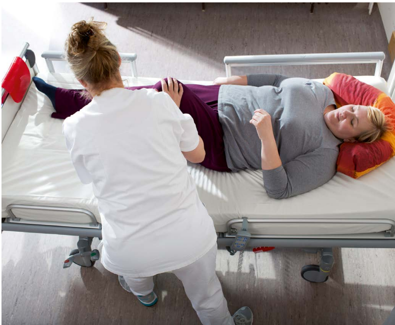
Abb. 1 Bewegungsunterstützung einer Patientin im Bett