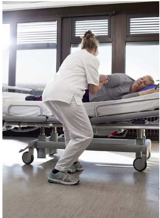
Abb. 9 Bewegungsunterstützung der Patientin: Verbindung von ergonomischer und ressourcenorientierter Arbeitsweise

Darüber hinaus sind fachkundige Beschäftigte in der Lage, mit Hilfe einer systematischen Funktionsanalyse die Möglichkeiten der Eigenbewegung des Menschen zu beschreiben und zu dokumentieren. In eine solche Dokumentation sind dann auch Hinweise zu notwendigen Unterstützungsmöglichkeiten (z. B. selbstständiges Aufrichten im Bett mit Hilfe eines Bettzügels möglich) aufzunehmen oder Hinweise dazu, wie der jeweilige Mensch zu dieser Eigenbewegung durch Bewegungsreize motiviert werden kann.