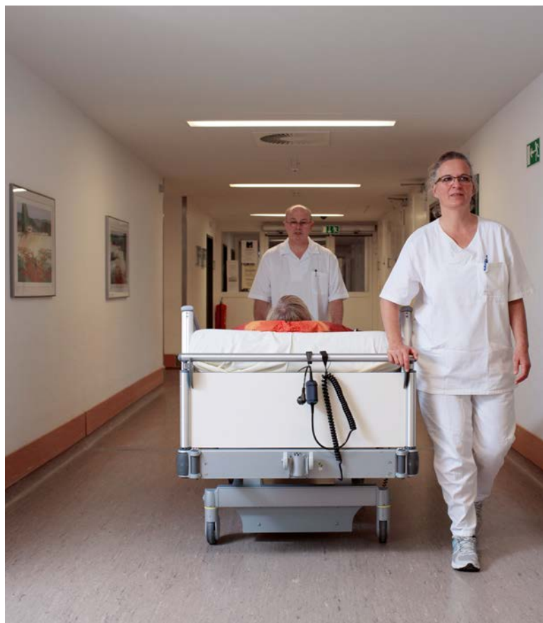
Abb. 6 Ergonomisches und sicheres Schieben eines Pflegebettes mit zwei Pflegekräften