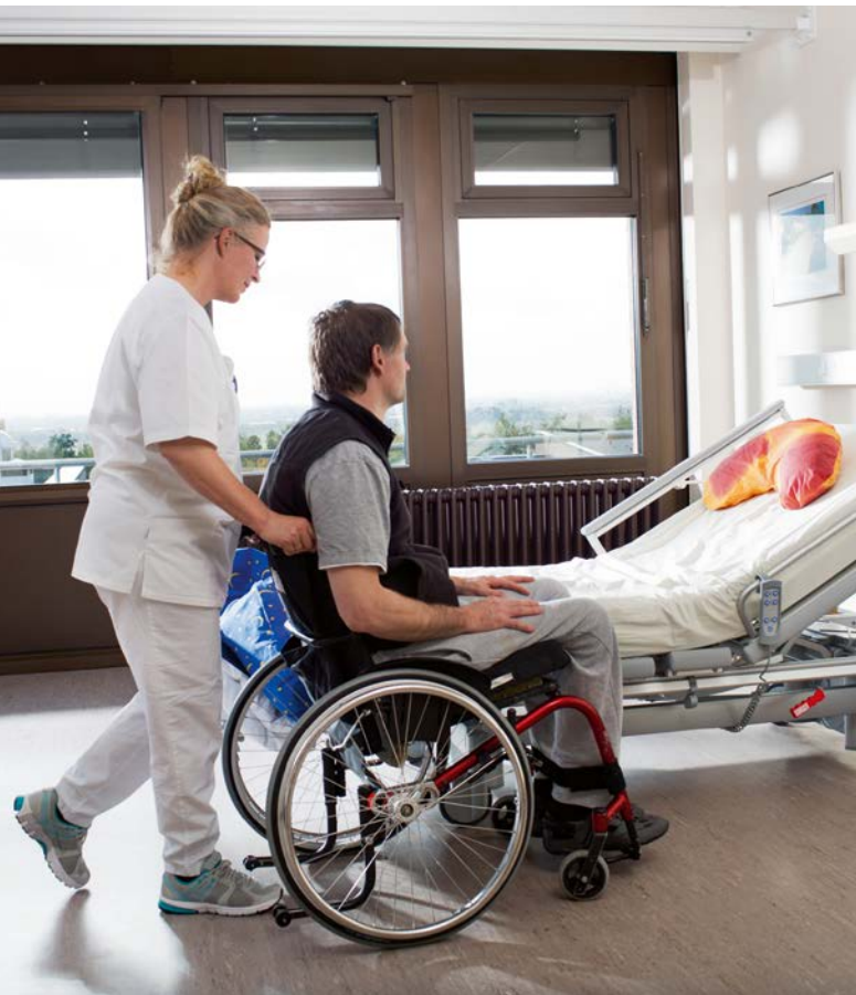
Abb. 2 Bewegungsfreiraum durch die geeignete Größe und Einrichtung des Pflegezimmers