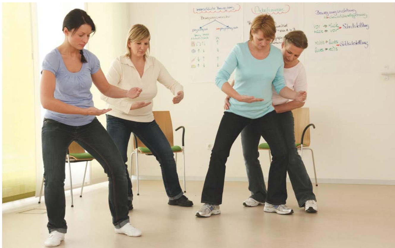
Abb. 10 Unterweisung in der ergonomischen Arbeitsweise: Ausgangsstellung und Körperhaltung

Bei Arbeitnehmerüberlassung liegt die Pflicht zur arbeitsplatz- und aufgabenbereichsbezogenen Unterweisung beim Entleiher (§12 ArbSchG, Abs. 2). Einrichtungen, die mit Arbeitnehmerüberlassung arbeiten, können somit von einer grundsätzlichen